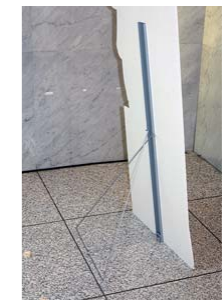
スチール製の自立型スタンド

ホテル側で、任意の場所に移動できる「等身大パネル」を用意 写真撮影などの「思い出づくり」に使用を想定