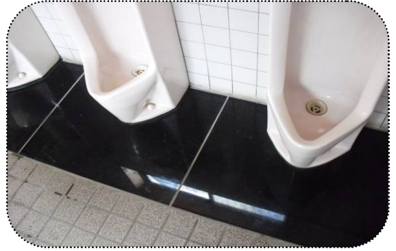
○伊那市高遠城址公園 [にのまる クリーン女性専用トイレ]