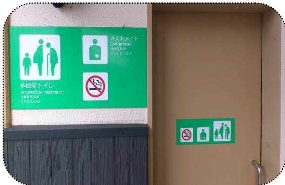
○トイレの案内板が多言語で分かり易い。管理者名や連絡先が明記されている。[下諏訪町]