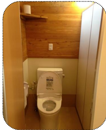
○木曾町 [開田高原 管沢公衆トイレ]