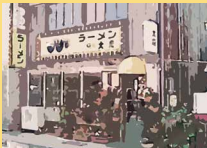
長年地域に愛された忘れがたき あの味を復活させました。

かつて、中野市で食べられていた「つけ焼そば」と、 「きのこ」のコラボメニューである「信州つけ焼そば」が誕生しました。