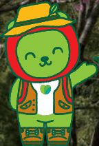
長野県PRキャラクター「アルクマ」(信州DCバージョン) ©長野県アルクマ