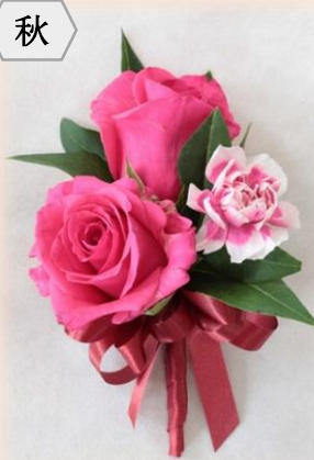
バラ・カーネーション