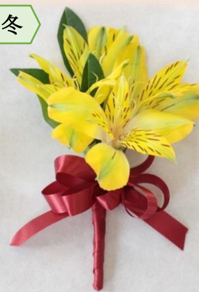
アルストロメリア