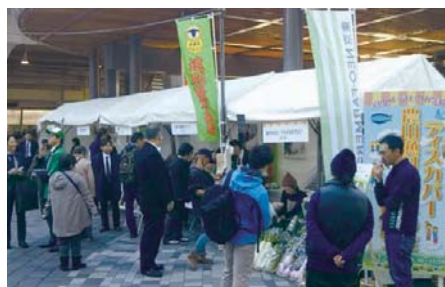
東京の有楽町におけるマルシェ（令和元年12月）

「ディスカバー農山漁村の宝」に選定された地区に対しては、農林水産省ホームページ等で活動を紹介するほか、様々なイベントへの出展支援を通じて、全国的な情報発信を行っています。