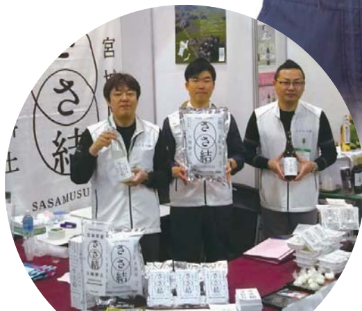
大崎の米『ささ結』ブランドコンソーシアム (宮城県大崎市) (第5回選定地区)