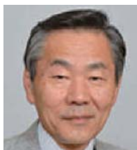
林 良博 国立科学博物館館長