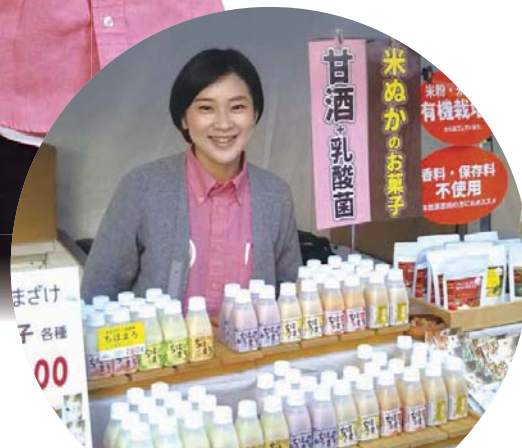
高千穂ムらたび協議会 (宮崎県高千穂町) (第3回選定地区)