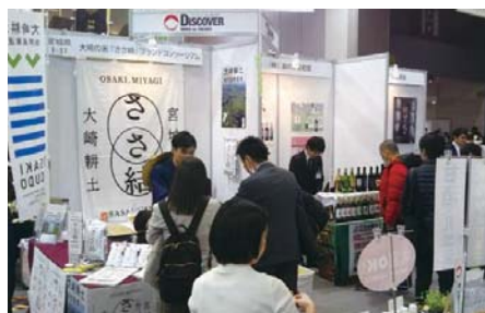
アグリフード EXPO 大阪（令和2年2月）