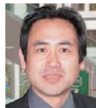
永島 敏行 俳優 (有) 青空市場代表取締役