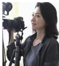
織作 峰子 大阪芸術大学教授 写真家