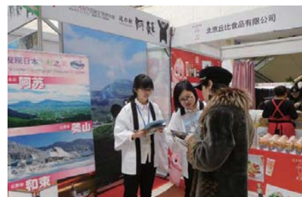
大連ジャパンブランド<中国大連市>（平成30年3月）