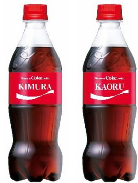
ネームボトルイメージ