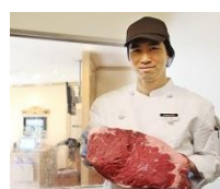
肉は、コックが 1 枚ずつ丁寧に店内でカット