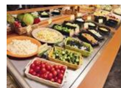
20 種類以上楽しめるサラダバー