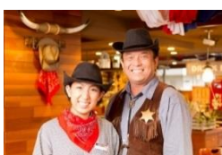
カウボーイ・カウガールが明るくお出迎え

今後も質の高い肉料理や充実したサラダバーを提供し、我が家のホームパーティーにお招きしたようなサービスで、地域の皆様に楽しんでいただけるレストランとなるよう努めてまいります。